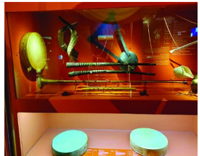
Musikinstrumente zur Zeit Jesu

Im Alten Testament konnten wir ein kleines nachgebautes Zelt sehen in das wir uns setzten. Dort wurde uns erklärt, was es damit auf sich hat. Außerdem verkleideten sich zwei Jungs als Sara und Abraham. Danach durften wir an alten Gerüchen riechen und eine alte Mehlmühle benutzen. Es waren auch alte Bücher mit alten Schriften ausgestellt.