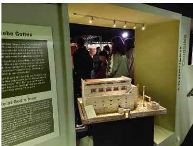
Tempel in Jerusalem (Modell)

Im Neuen Testament wurden wir in Gruppen eingeteilt, wo wir dann verschiedene Themen der damaligen Zeit durchlesen sollten, um es dann den anderen zu erklären bzw. zu präsentieren.