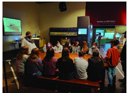
Wir bei der Aufgabenverteilung im Raum des Neuen Testaments

Nachdem die Führung fertig war, sind wir noch in das Main-Taunus-Center Shoppen gefahren. Insgesamt war es ein sehr schöner und lustiger Tag.